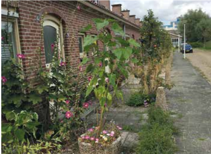
Cornelis Buysstraat in Alkmaar. Op de plek waar grindtegels lagen, legden we met bewoners en vrijwilligers smalle borders aan met vaste kruidenplanten en appelboompjes. In de betonbakken kwamen bloembollen en fleurige planten.