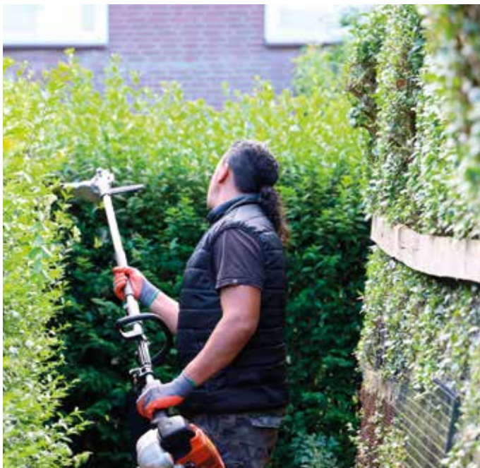
De stegen in Alkmaar Zuid zijn door bewoners met hulp van vrijwilligers weer helemaal opgeknapt.