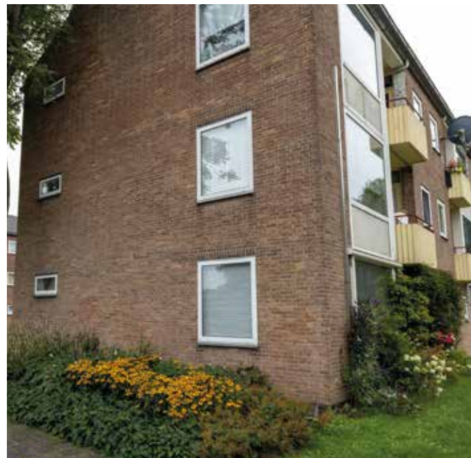
Staatsliedenbuurt Alkmaar. Aan de gevels zoemde het deze zomer van de bijen door de nieuwe bloemenborders.