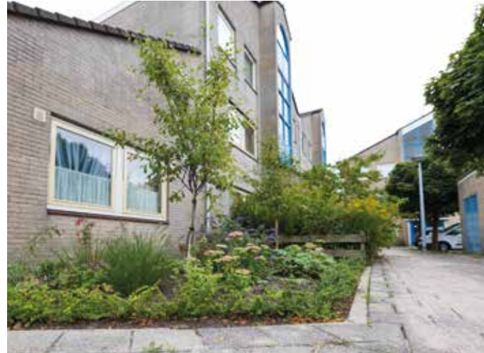
Braspenningstraat in Alkmaar Noord. In overleg met de bewoners werden niet-gebruikte privétuintjes veranderd in mooi opgeknapte gezamenlijke tuinen.